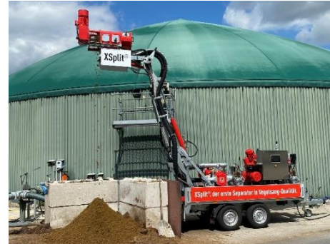
Bild 4: Der Pressschneckenseparator XSplit für die Separation von Gülle und Gärresten (hier als Systemlösung abgebildet).