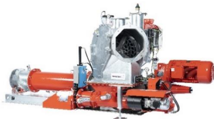
Bild 1: Das weiterentwickelte Flüssigfütterungssystem PreMix sorgt für eine leistungsstarke und zuverlässige Feststoffdosierung.